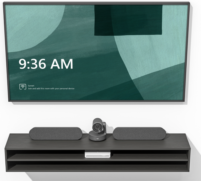
Logitech RoomMate con sistema Rally Plus