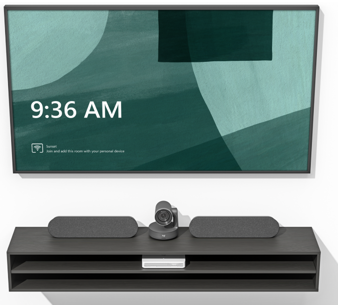
Logitech RoomMate con il sistema Rally Plus